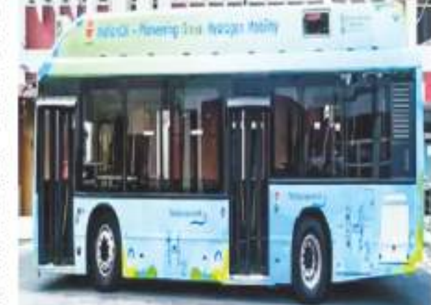
के तहत 2 ईंधन सेल बसों का पहला सेट 25 सितंबर को इंडिया गेट से लांच किया जा रहा है। यह हरित गतिशीलता की दिशा में महत्वपूर्ण कदम है। उल्लेखनीय है कि हरित हाइड्रोजन का उत्पादन नवीकरणीय ऊर्जा का उपयोग करके किया जाता है। यह कम कार्बन और आर्गनिक आर्बिथिक मार्गों में महत्वपूर्ण भूमिका निभा सकता है। भारत की पहली हाइड्रोजन ईंधन सेल बस सर्विस लोह और लड़ाई में शुरू होने वाली है, जो पर्यावरण-अनुकूल परिवहन के एक नए युग को शुरूआत करेगी।

नई दिल्ली। केंद्रीय पेट्रोलियम और प्राकृतिक गैस मामलों के मंत्री हरदीप पुरी सोमवार 25 सितंबर को राजधानी दिल्ली के कर्तव्य पथ पर पहली ग्रीन हाइड्रोजन ईंधन सेल बस को हरी झंडी दिखाएंगे। बस को सुबह 10:15 बजे नेताजी सुभाषचंद्र बोस प्रतिमा, शाहनवाज रोड, इंडिया गेट पर हरी झंडी दिखाई जाएगी। मंत्रालय के मुताबिक इंडियन ऑयल ने दिल्ली, हरियाणा और यूपी में चिन्हित मार्गों पर ग्रीन हाइड्रोजन द्वारा संचालित 15 ईंधन सेल बसों का परिचालन प्रीक्षण करने के लिए एक कार्यक्रम शुरू किया है। कार्यक्रम