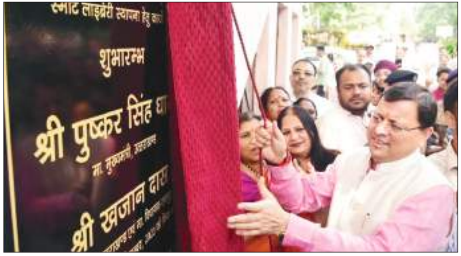
उत्तराखंड के मुख्यमंत्री पुष्कर सिंह धामी ने देहरादून स्थित डी.ए.वी.पी.जी कॉलेज में प्रधानमंत्री नरेंद्र मोदी के मन की बात कार्यक्रम के 105वें संस्करण को सुना। इस अवसर पर मुख्यमंत्री ने डी.ए.वी.पी.जी कॉलेज के स्मार्ट लाइब्रेरी स्थापना के कार्यों का शुभारंभ भी किया।

बिना गांवों में कोई काम आगे नहीं बढ़ता। उन्होंने कहा कि आप प्रशासन के लिए कर्णधार हैं। आपके पास गांव की सभी जानकारी होती है, जिसके आधार पर कई कार्य सहजता से संपन्न हो जाते हैं। कोटवार गांव के चलते-फिरते गुगल हैं। मुख्यमंत्री ने इस अवसर पर कोटवारों पर सौगातों की बरसात करते हुए कहा कि मैं सरकार नहीं परिवार चलाता हूँ और इस परिवार का मुखिया होने के नाते हर वर्ग के सुख-दुख का ध्यान रखना मेरा धर्म है। उन्होंने यह घोषणा भी कि सभी कोटवारों को स्वास्थ्य बीमा योजना का लाभ दिया जाएगा। कोटवारों की वर्दी का रंग भी अब खाकी होगा। कोटवारों को सेवानिवृत्ति पर अब एक लाख रुपये धनराशि प्रदान की जाएगी। हर कोटवार को सीयूजी मोबाइल सिम दी जायेगी और रिचार्ज की व्यवस्था भी शासन द्वारा किया जायेगा।