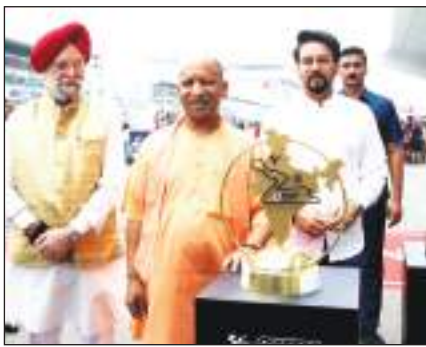
उत्तर प्रदेश के मुख्यमंत्री योगी आदित्यनाथ, केंद्रीय मंत्री अनुराग ठाकुर, हरदीप सिंह पुरी 'मोटो जीपी भारत' के ट्रॉफी के साथ।