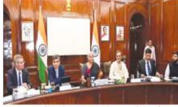
करने पर ध्यान केंद्रित किया गया है। समूह की रिपोर्ट के पहले खंड को इस महीने की शुरुआत में नई दिल्ली शिखर सम्मेलन में जी-20 नेताओं ने स्वीकार किया था। मंत्रालय ने बताया कि जी-20 स्वतंत्र विशेषज्ञ समूह इस समय भारत में अपनी रिपोर्ट के दूसरे खंड पर काम कर रहे हैं, जिस पर माराकेच में होने वाली आईएमएफ, विश्व बैंक की वार्षिक बैठक के मौके पर होने वाली जी-20 बैठक में चर्चा की जाएगी। उल्लेखनीय है कि भारत की जी-20 अध्यक्षता के तहत चौथी और अंतिम वित्त मंत्रियों और केंद्रीय बैंक के गवर्नरों (एफएमसीबीओ) की बैठक अगले महीने मोरक्को में होने वाली है।

नई दिल्ली। केंद्रीय वित्त मंत्री निर्मला सीतारमण ने यहां जी-20 स्वतंत्र विशेषज्ञ समूह (आईईजी) से मुलाकात की। इस मुलाकात के दौरान बहुपक्षीय विकास बैंकों (एमडीबी) को मजबूत करने पर चर्चा हुई। वित्त मंत्रालय ने एक्स पोस्ट पर दी जानकारी में बताया कि सीतारमण ने नई दिल्ली में जी-20 स्वतंत्र विशेषज्ञ समूह से मुलाकात की। इस दौरान बहुपक्षीय विकास बैंकों (एमडीबी) को मजबूत करने पर चर्चा हुई। इस दौरान आईईजी के सह-संयोजक पूर्व अमेरिकी वित्त मंत्री लॉरेन समर्स और 15वें वित्त आयोग के पूर्व अध्यक्ष एनके सिंह और अन्य मौजूद रहे। भारत की अध्यक्षता में जी-20 ने आईईजी की स्थापना हुई है, जिसमें एमडीबी को मजबूत