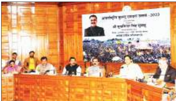
परिवहन सुविधा सुनिश्चित करने के दृष्टिगत मंडी-मनाली राष्ट्रीय राजमार्ग की मरम्मत कार्य युद्ध स्तर पर पूरा करने के निर्देश दिए। उन्होंने कहा कि बरसात के दौरान

टीएम एक्शन इंडिया/कुल्लू/श्याम कुल्लू: मुख्यमंत्री ठाकुर सुखविंदर सिंह सुखरू ने इस वर्ष 24 से 30 अक्टूबर, 2023 तक आयोजित किए जा रहे अंतरराष्ट्रीय कुल्लू दशहरा उत्सव के पूर्वावलोकन कर्तन रोजर कार्यक्रम का शुभारंभ कर इसका ब्रॉशर जारी किया। गत दिवस को राज्य स्तरीय कुल्लू दशहरा समिति की बैठक की अध्यक्षता करते हुए मुख्यमंत्री ने कहा कि यह उत्सव इस क्षेत्र में पर्यटन को बढ़ावा देने में एक महत्वपूर्ण कदम साबित होगा। मुख्यमंत्री ने अधिकारियों को उत्सव के लिए क्षेत्र में निर्बाध