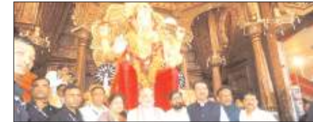
शाह हर साल लालबाग के राजा के दर्शन के लिए मुंबई आते हैं। वह इस साल भी लालबाग के राजा के दर्शन करने आए थे। लालबाग के राजा को सौगंध पिता के नाम से जाना जाता है। इसलिए यहां लाखों श्रद्धालु दर्शन के लिए आते हैं। साथ ही कई महशूर हस्तियां भी लालबाग के राजा के दर्शन के लिए आती हैं। बॉलीवुड अभिनेता, मराठी कलाकार और कई बड़े राजनेता लालबाग देखने आते हैं। गृह मंत्री शाह ने लालबाग के राजा के भी दर्शन किए।

टीम एक्शन इंडिया/कानपुर केंद्रीय गृह मंत्री अमित शाह ने बप्पा के दर्शनकिये। शाह महाराष्ट्र के मुख्यमंत्री एकनाथ शिंदे और महाराष्ट्र के उपमुख्यमंत्री देवेन्द्र फडणवीस के साथ 'लालबाग के राजा गणपति मंडल' पहुंचे। जहां पर सभी नेताओं के साथ शाह ने गणेश भगवान का दर्शन किये, बता दें की अमित शाह हर साल 'लालबाग के राजा का दर्शन करने आते हैं। इस साल भी गृह मंत्री अमित शाह ने अपने परिवार के साथ लालबाग के राजा के दर्शन किए, गृहमंत्रों