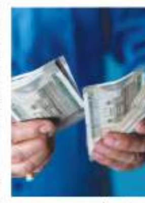
रखा जाएगा। संभव है कि केंद्रीय कैबिनेट की अगामी बैठक में डीए बढ़ोतरी की घोषणा हो जाएगी। गत वर्ष दीवाली से पहले