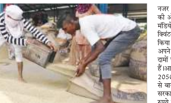
बाजरे की सरकारी खरीद के लिए बढ़ रहा किसानों का इंतजार नारनौल में बाजरे का सरकारी समर्थन मूल्य पर खरीद को लेकर किसानों को इंतजार बढ़ता जा रहा है, लेकिन सरकार की ओर से अभी तक खरीद को लेकर कोई आदेश जारी नहीं किए हैं, जिस कारण किसानों को आँने-पौने दामों पर अपने अनाज को आदतियों के वहां बेचना पड़ रहा है। सरकारी खरीद शुरू नहीं होने से आदती तो खुश