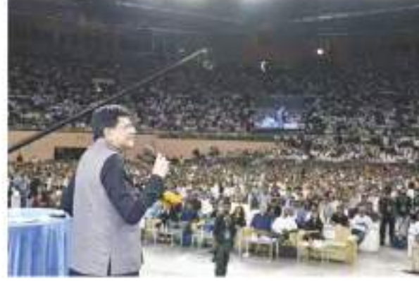
पीयूष गोयल ने कहा कि भारत की विकास के लिए उत्सुक भारत के लचीला बनने और भारत की प्रगति में योगदान दें। भारत सरकार ने स्टार्टअप इंडिया पहल शुरू की है। इस पहल का उद्देश्य स्टार्टअप के विकास को समर्थन और बनाए रखना है। देश में मान्यता प्राप्त स्टार्टअप की संख्या 2016 में 450 से बढ़कर 2023 में एक लाख से अधिक हो गई है। इन स्टार्टअप को उद्योग संवर्धन और आंतरिक व्यापार विभाग (डीपीआईआईटी) ने मान्यता दी है। इन स्टार्टअप में से लगभग आधे टियर 2 और टियर 3 शहरों से हैं। यह वृद्धि केवल महानगरीय शहरों तक ही सीमित नहीं है बल्कि उप-नगरीय और ग्रामीण क्षेत्रों में भी देखी जा सकती है।

नई दिल्ली। केंद्रीय वाणिज्य और उद्योग मंत्री पीयूष गोयल ने कहा कि सरकार से मान्यता प्राप्त स्टार्टअप की संख्या 2016 में 450 से बढ़कर इस समय एक लाख से ज्यादा हो गई है। उन्होंने यहां उद्यमियों को संबोधित करते हुए भरोसा जताया कि 2047 तक भारत की अर्थव्यवस्था में तेजी से वृद्धि होगी। वाणिज्य मंत्री ने शनिवार को राजधानी दिल्ली में आयोजित बड़ा बिजनेस के 'एंट्रोप्रेनोर्स लॉन्चपैड' कार्यक्रम को संबोधित करते हुए यह बात कही। गोयल ने अपने संबोधन में भारत में कारोबारी सुगमता, व्यवसाय शुरू करने और संवर्धित करने को अहम बनाने के लिए सरकार की प्रतिबद्धता को भी रेखांकित किया। गोयल ने कहा कि भारत की विकास के लिए उत्सुक भारत के